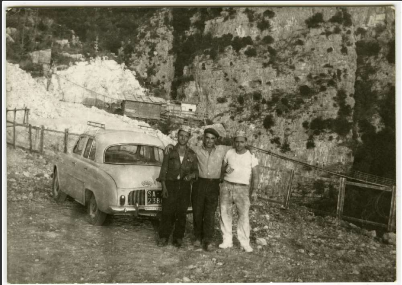
Sacco - ritratto di tre operai con lo sfondo il ponte di Sacco in costruzione